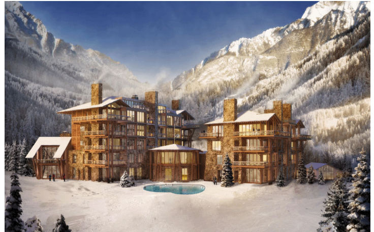
Vue d'ensemble 1