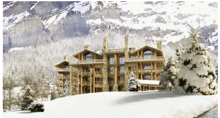
Vue d'ensemble 2